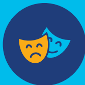
Sztuka i rozrywka